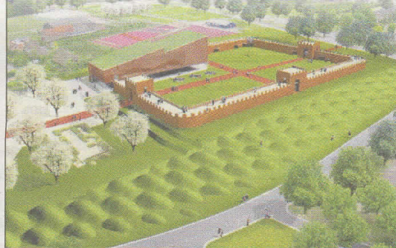
Artist's Impression van Castellum Hoge Woerd in De Meern.

digd raakt. De gemeen- te werkt bij het project samen met de Rijks- dienst voor het Cultu- reel Erfgoed. De kosten bedragen in totaal circa 15 miljoen euro. Ver- schillende partijen heb- ben bijgedragen aan de financiering. Meer informatie: www.castellumhoge- woerd.nl .