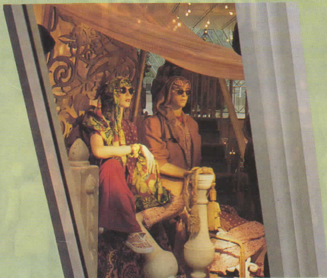
De fraaie etalage van Mexx

De verkoopster van Boa Boa: "Mijn ervaring is dat er van alles komt in de P.C. Hoofstraat. Jong en oud, mensen met geld en mensen met minder geld. Nu is