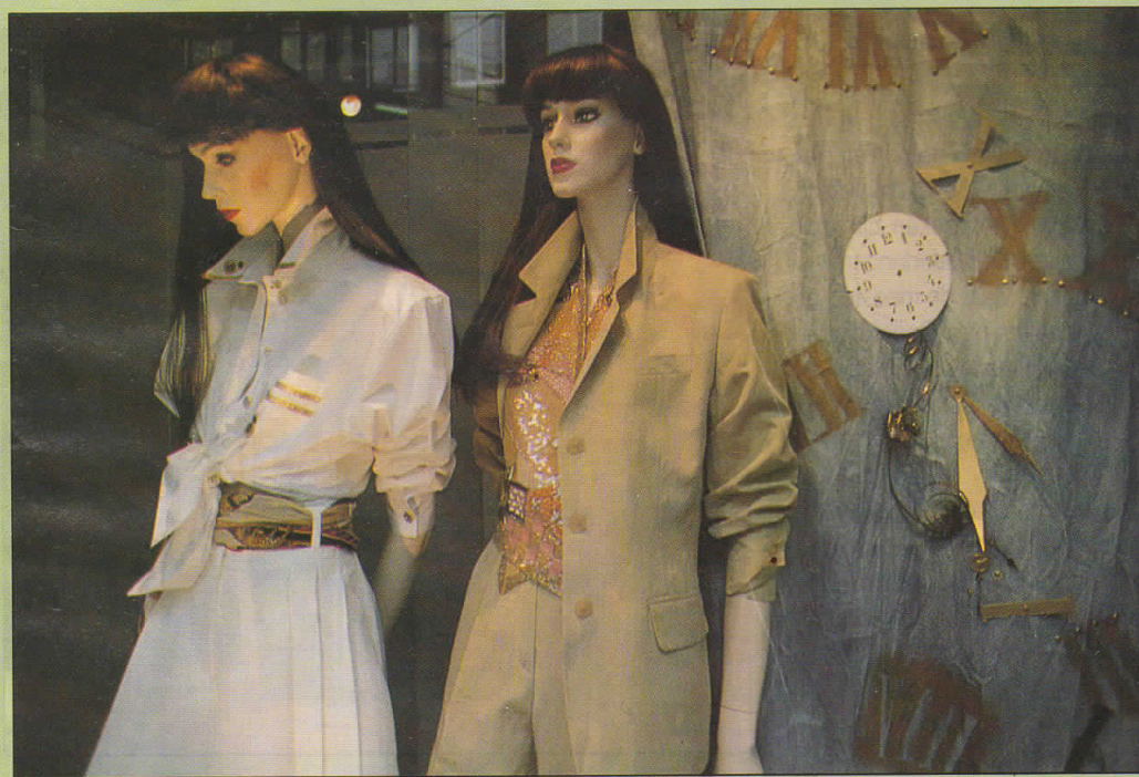
Leeser: Het langste gevestigd

Ik heb vroeger een tijd gehad dat ik in Amsterdam overal uitging, de cafés rond de Nieuwmarkt en de cafés op de Zeedijk. Dat was in een tijd dat het nog kon, dat je daar nog gewoon kwám. En de mensen die je daar allemaal tegenkwam, die lopen nu hier. Ik zie ze en ik hoor ze. De Haring Arie's zeg maar, dat type mens. De jongens die het gemaakt hebben. Ze komen naar de P.C. Hooftstraat om het geld er doorheen te jagen, maar ook om